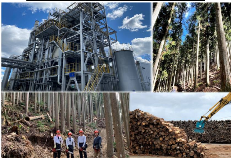
当社木質バイオマス発電所と所有森林

これにより、当社グループ全体として合計4000ha（東京ドーム855個分）の森林管理を手がけることとなり、 2050年カーボンニュートラル を見据えた グリーン成長戦略の一翼を担う べく、SDGs・ESG時代に相応しい 新たなエネルギー・林業事業の創造 をつうじて、 持続可能な資源循環型経済の構築 に貢献してまいります。