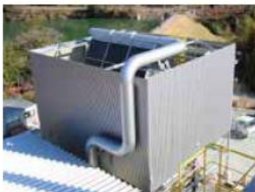
蒸気復水器 タービン排気をファンで冷却し水に戻します。