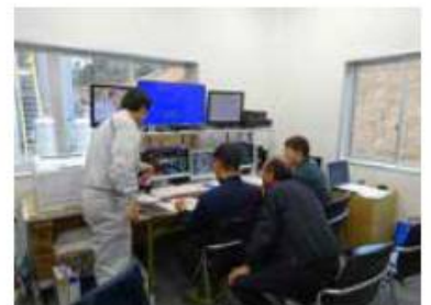
中央制御室 ボイラー及びタービン発電機その他補機類を管理制御します。