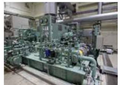
蒸気タービン・発電機 ボイラーから発生した蒸気を利用して発電を行います。