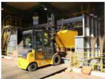
チップ定量フィーダ 燃料を燃焼室へ定量供給する機械です。