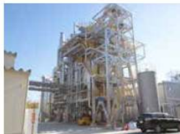
トラベリングストーカボイラー 燃料を燃焼させて蒸気を発生させます。